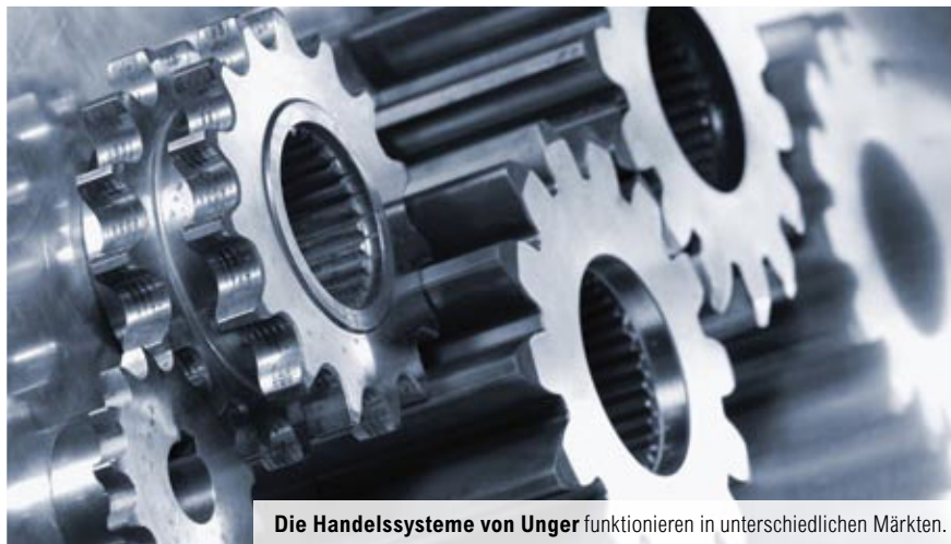
Die Handelssysteme von Unger funktionieren in unterschiedlichen Märkten.

Angewendet auf unser Beispiel bedeutet das: In der MAN-Aktie ist die Spanne am 22. Oktober 2008 größer als die Spanne am Vortag. Spanne gestern: 39,48 (Hoch) – 37,06 (Tief) = 2,42; Spanne vorgestern: 40,89 (Hoch) – 39,10 (Tief) = 1,79. Da außerdem der Schlusskurs niedriger ist als der Eröffnungskurs, sind beide Bedingungen für das Setup erfüllt. Unser Einstiegsniveau liegt bei